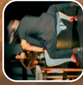
VOLER-HO LA FENOMENAL