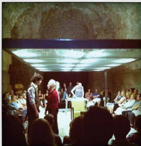
FITT 2013 - El loco y la camisa Banfield Teatro Ensamble (Argentina)