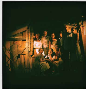
FITT 2011 - Fermentación Teatro de los Sentidos (Colòmbia)