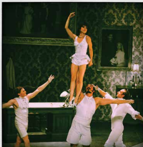
FITT 2015 - The Elephant in the room Cia. Cirque Le Roux (França)